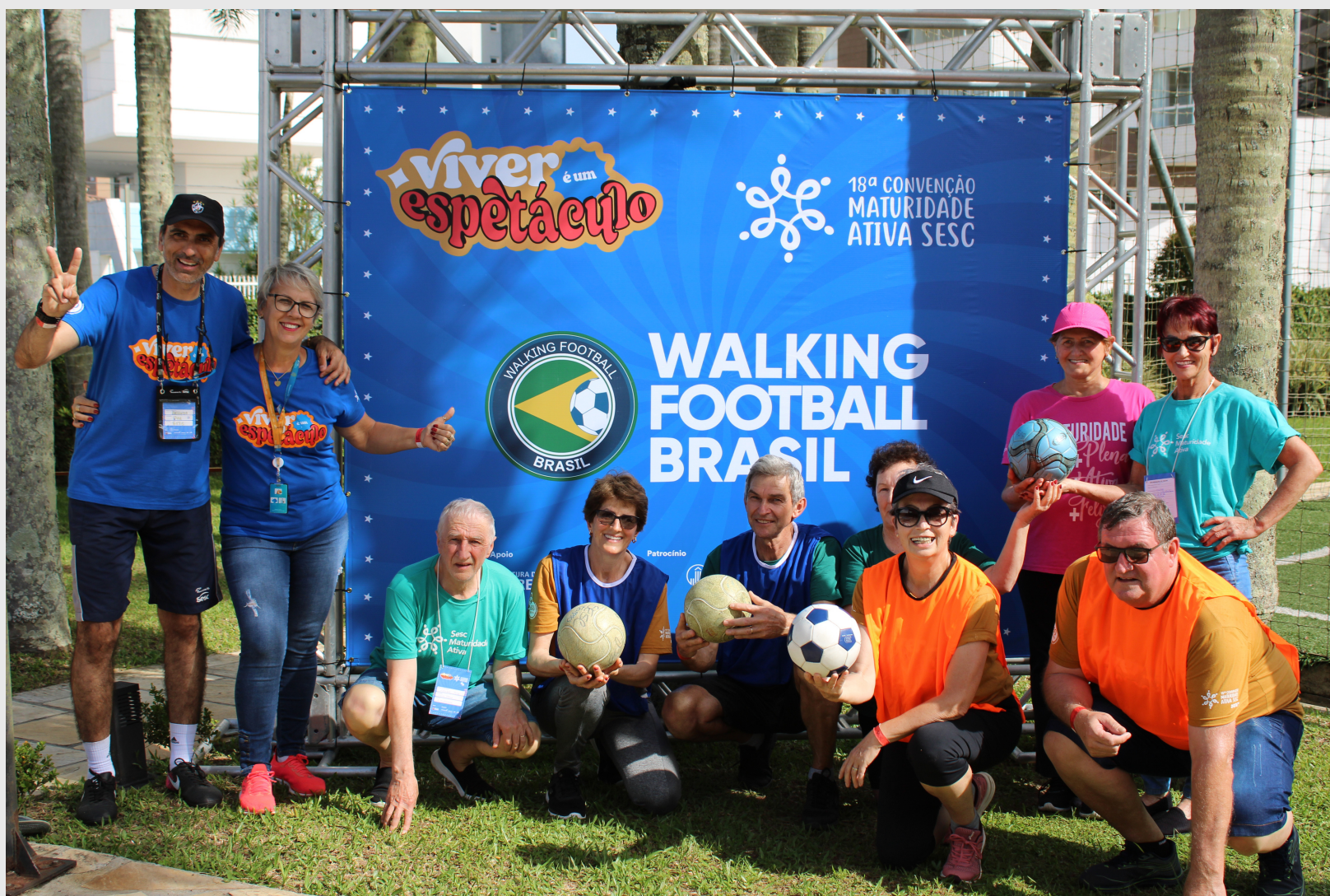
Sesc Torres - Rio Grande do Sul