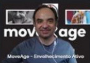
MoveAge - Envelhecimento Ativo