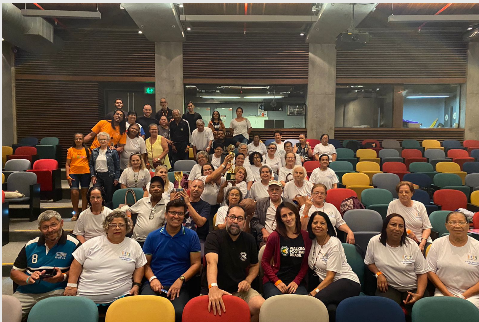
Turma 60+ de Cajamar no Museu do Futebol