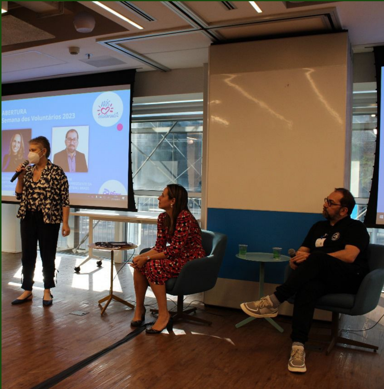
Abertura da Semana de Voluntariado da Pfizer.